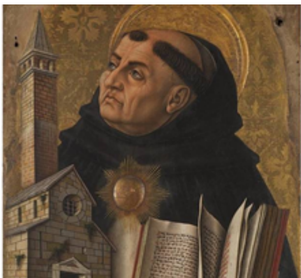
Sto Tomás de Aquino. Dominico

Tomás de Aquino. Nace en Italia, 1224/1225 el 7 de marzo de 1274, fraile, teólogo y filósofo católico perteneciente a la Orden de Predicadores, es considerado el principal representante de la enseñanza escolástica y una de las mayores figuras de la teología sistemática. En materia de metafísica, su obra representa una de las fuentes más citadas del siglo XIII además de ser punto de referencia de las escuelas del pensamiento tomista y neotomista.