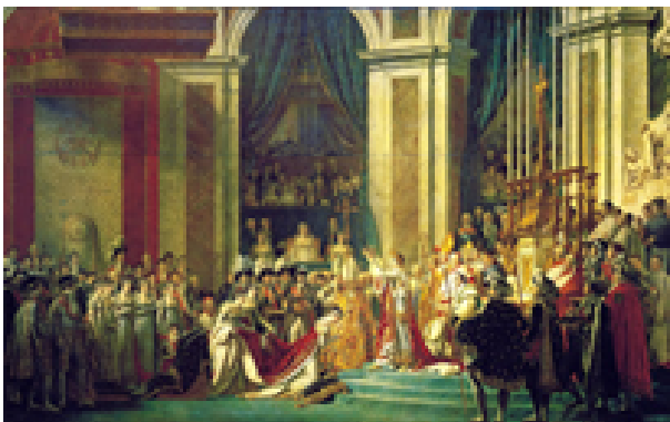
Coronación del Papa a los reyes

Al estamento civil se le reservaba la investidura feudal con otorgamiento de los derechos temporales de regalía y demás atributos seculares. Los así investidos se debían al papa en lo religioso y al soberano laico en lo civil.