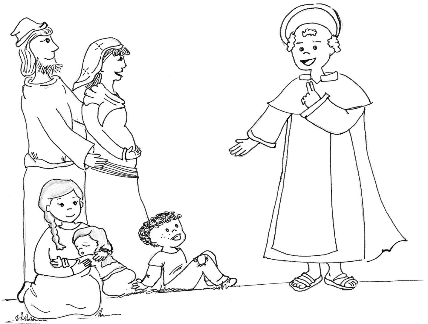
UN DIBUJO PARA COLOREAR DE S. VICENT PREDICANDO A UNA FAMILIA H